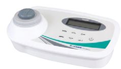
CD 200 COD 檢測儀