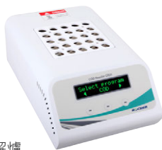
CR 25 加熱分解爐