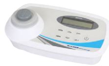
WD 100 4合1水質分析儀